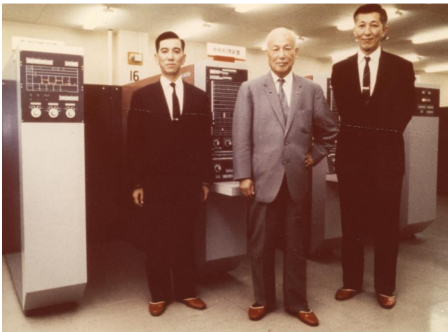
富士通アーカイブズ展示エリア

これからも、開発・製造部門だけでなく全ての部門で改善に取り組み、製品・サービス・お客様対応の品質向上に取り組んでまいります。